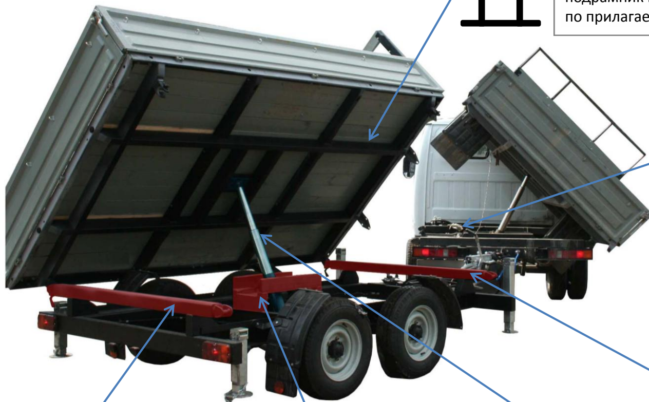
Траверса с серьгами Задняя – 1 шт.